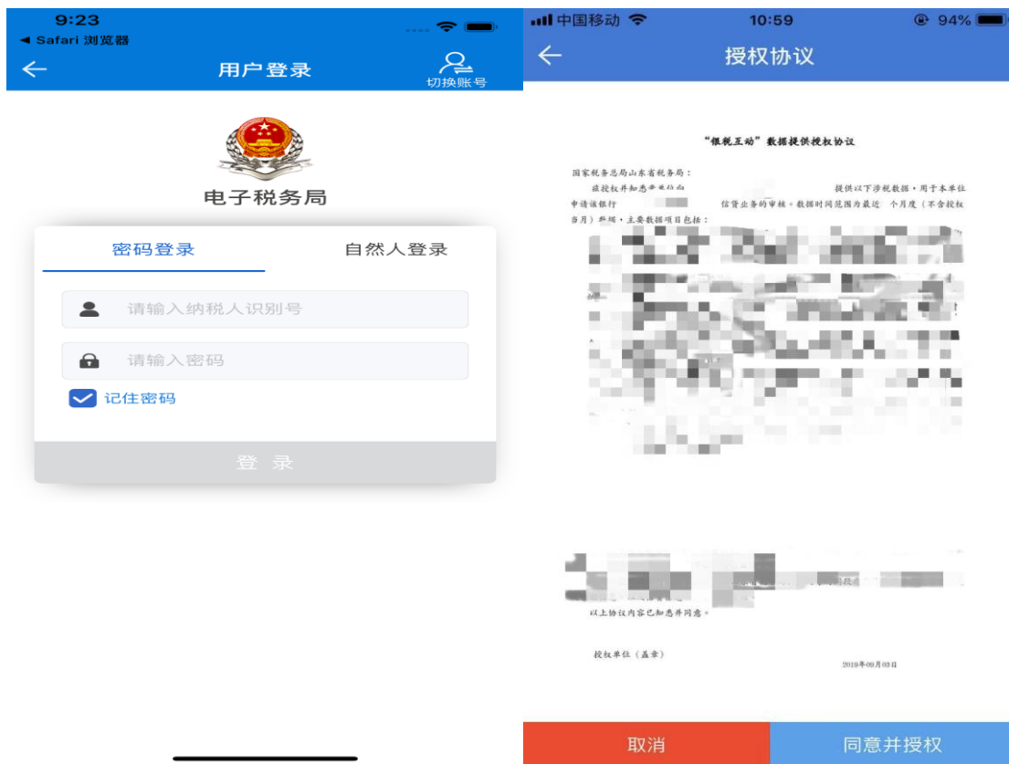
山东省电子税务局 APP 界面

纳税人在手机银行 APP 完成操作后，系统跳转到山东省电子税务局 APP 端，登录后进行授权操作。