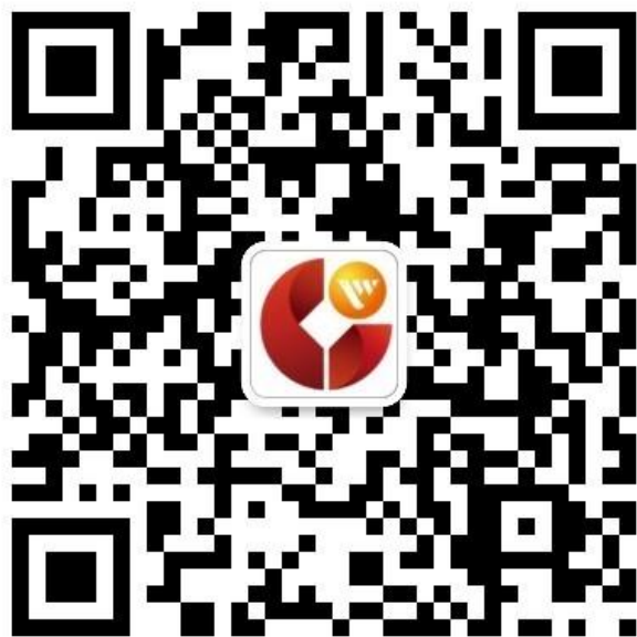
莱商银行微信公众号二维码

3. 微信公众号申请方式。以莱商银行“税易贷”产品为例，在平台点击“立即申请”按钮后，系统自动弹出二维码。手机扫描后进入莱商银行微信公众号，点击“贷款”，填写相关申请信息。