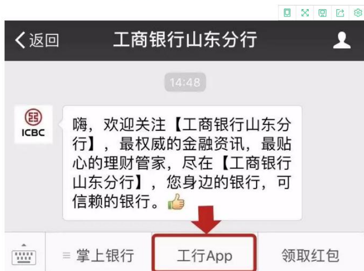
工商银行 APP 界面

纳税人在手机银行 APP 完成操作后，系统跳转到山东省电子税务局 APP 端，登录后进行授权操作。